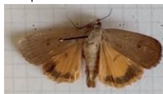
Adulto di Noctua comes (Noctuidae)

la minima presenza sono state raccolti pochissimi esemplari e si è potuto classificare solo nove individui, ottenuti da allevamento. In tutto sono state trovate tre sole specie: Noctua comes (Hübner, 1813), con sette esemplari, Noctua fimbriata (Schreber, 1759) ed Euxoa aquilina (Denis e Schiffermüller, 1775), entrambe con un individuo. Si tratta di tre specie molto comuni e già segnalate come dannose alla vite. In ricerche condotte in tutte le provincie viticole del Piemonte sono risultate le tre specie più frequenti e costituivano nel complesso sempre oltre il 70% del totale.