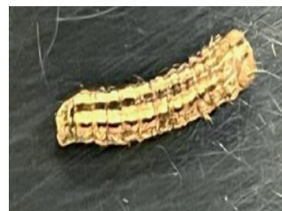
Larve di Xestia c-nigrum e di Mythimna l-album