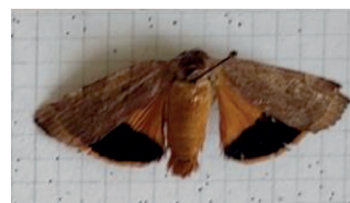
Adulto di Noctua fimbriata (Noctuidae)

Più ampio è risultato lo spettro delle specie di larve raccolte dal suolo nelle località Valgella e Tresivio Inferno e sottoposte ad analisi molecolare. I risultati hanno nuovamente evidenziato la presenza di Noctua comes , oltre ad altre specie di nottue: